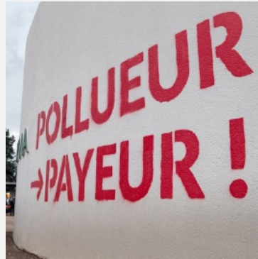
Inscription « pollueur → payeur » sur l'enceinte du site Arkema

En matière de législation française, c'est le code de l'environnement qui encadre ce genre de situation. Il a notamment instauré les principes de précaution, d'action préventive et de correction , qui visent à faire adopter des « mesures effectives et proportionnées » pour prévenir, éviter, réduire la portée ou compenser les éventuelles atteintes sur l'environnement et la biodiversité. Il a aussi instauré le principe de pollueur-payeur , mis en avant par les militant.es. Plutôt que d'être un réel outil pour lutter contre les pollutions et surtout réparer les éventuels dommages causés sur l'environnement, il consiste surtout à autoriser des organismes à polluer, en échange d'un dédommagement financier.